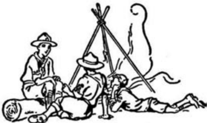
Členové skautské rodiny: vlče, skaut a rover.